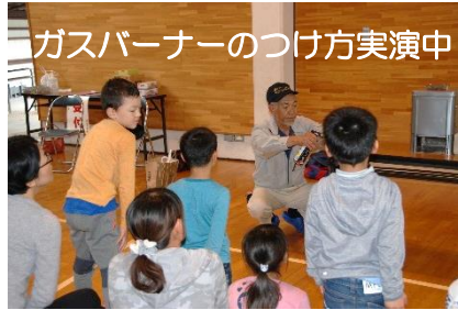
ガスバーナーのつけ方実演中