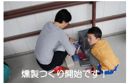
燻製づくり開始です！